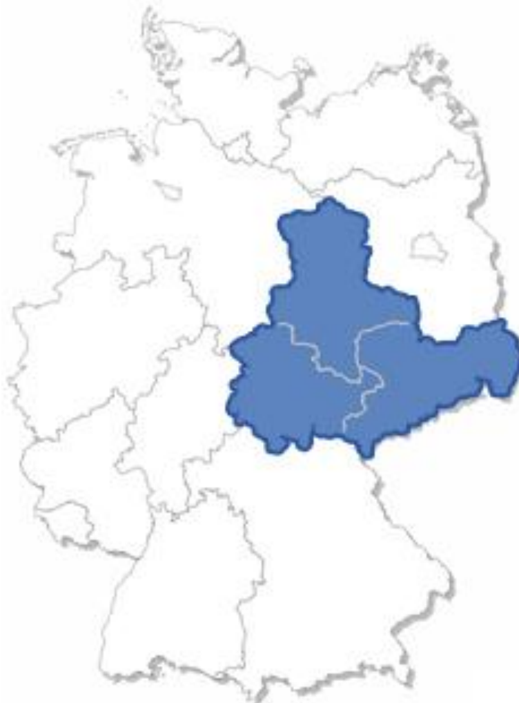
Abbildung 1: JugendUnternimmt 2011/2012 in Mitteldeutschland

Über 300 Schüler haben für den aktuellen Wettbewerb 2011/2012 eine Geschäftsidee eingesandt. Besonders in Sachsen ist der Wettbewerb sehr gut angenommen worden. Insgesamt 125 Schüler aus dem Freistaat Sachsen haben an JugendUnternimmt teilgenommen. Dieser Erfolg zeigt, dass der Schülerwettbewerb JugendUnternimmt in Mitteldeutschland angekommen ist.