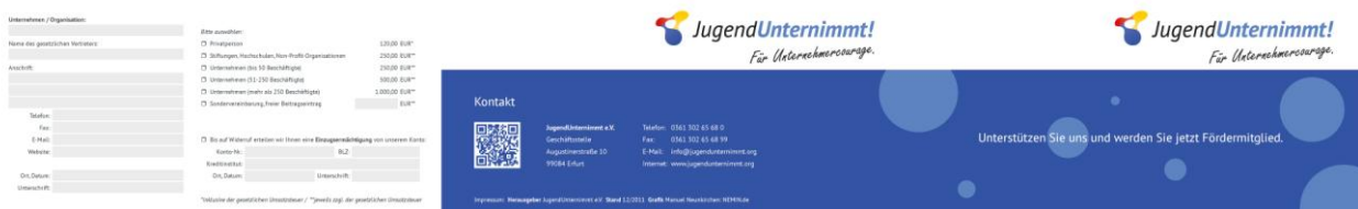
Abbildung 7: JugendUnternimmt-Fördermitgliedschaft

Wenn Sie Fördermitglied von JugendUnternimmt werden möchten oder für die Fördermitgliedschaft werben wollen, erhalten Sie alle nötigen Unterlagen und Informationen in der Geschäftsstelle.