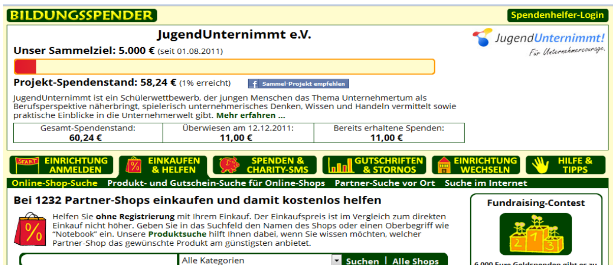
Abbildung 5: JugendUnternimmt -Spender-Shop bei Bildungsspender.de

Eine andere Möglichkeit ist die Online-Plattform Bildungsspender.de. Hier hat JugendUnternimmt einen Spender-Shop eingerichtet. Dort können Sie ebenfalls JugendUnternimmt unterstützen, ohne selbst mehr für den Online-Einkauf auszugeben (ebenfalls Affiliate-Provisionen). Über 1100 Partner-Shops sind dort registriert, um der guten Sache zu helfen Also starten Sie Ihren Einkauf über den JugendUnternimmt -Spender-Shop und probieren es aus. Sie müssen sich nicht registrieren. Wir freuen uns natürlich sehr über Ihre Unterstützung.